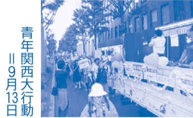
青年関西大行動 11月9日