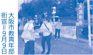
大阪市教青年部 街宣 11月9日