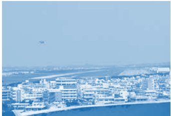
普天間飛行場とオスプレイ