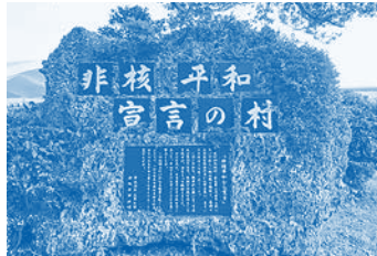
伊江島のたたかい