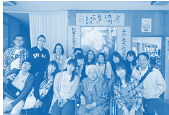
ヌチドゥタカラの家